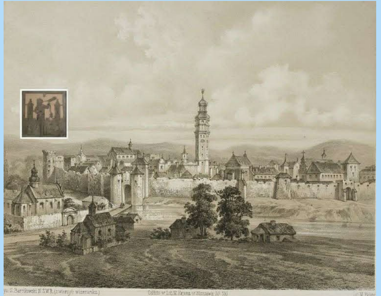
Wzrost S. Barczowski N. S. W. R. (z wizerunku wizerunku.)