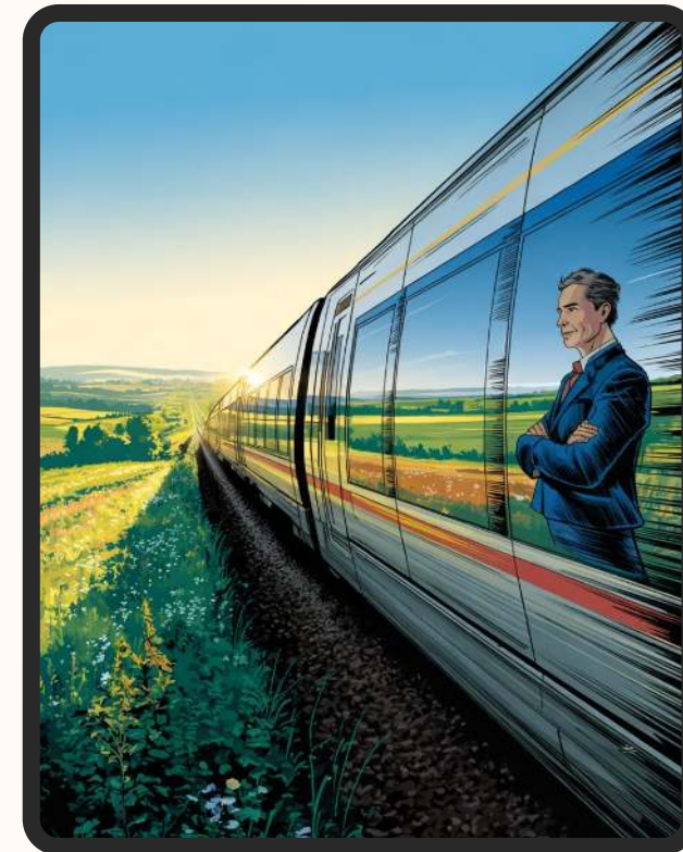
Dzisiejszy nowoczesny pociąg