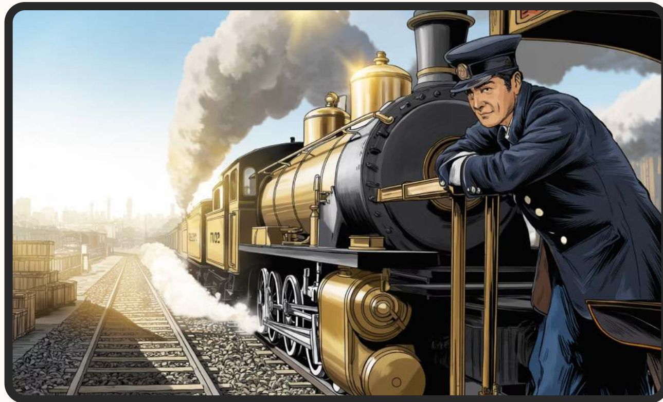
Stary parowóz z 1902 roku