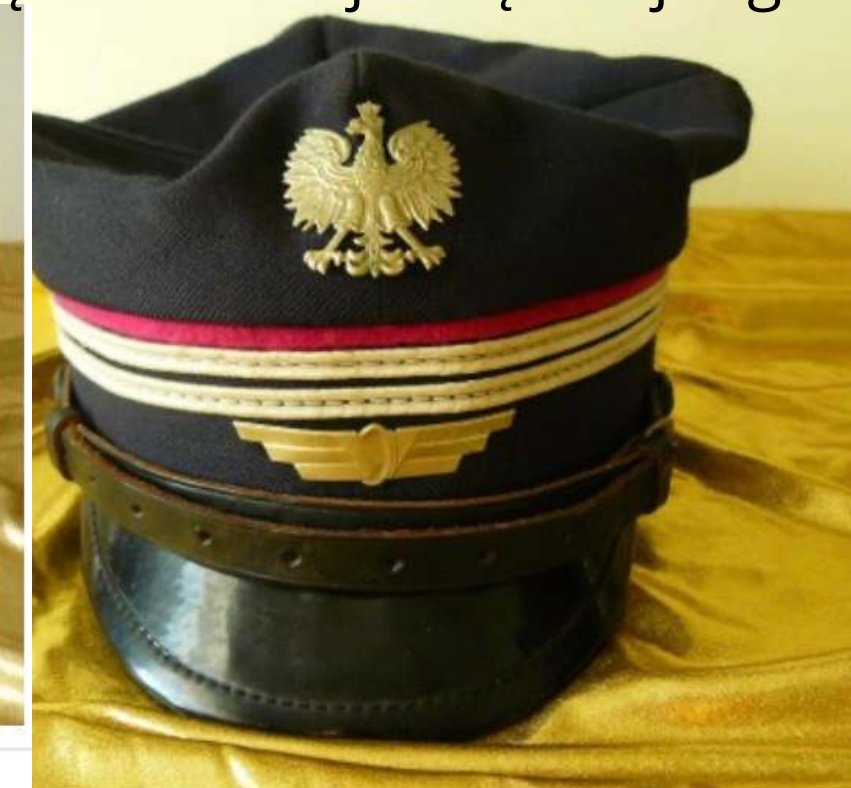
Czapka umundurowania kolejowego po 1990 r