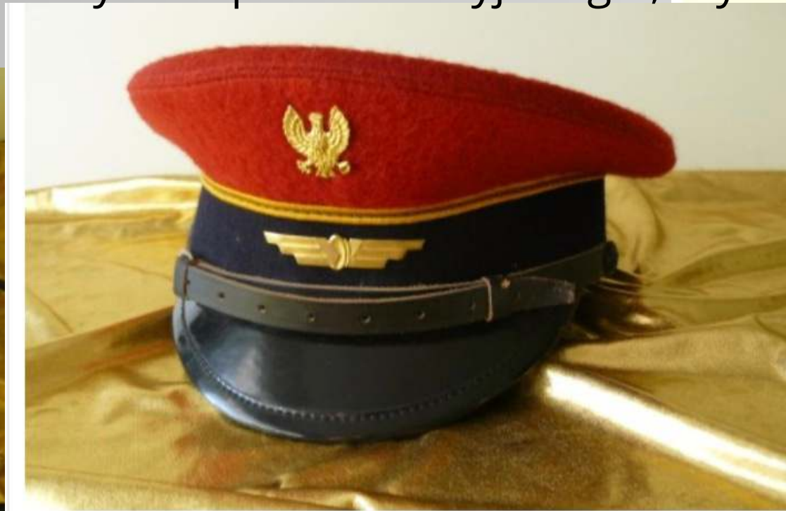
Czapka dyżurnego ruchu do 1990 r