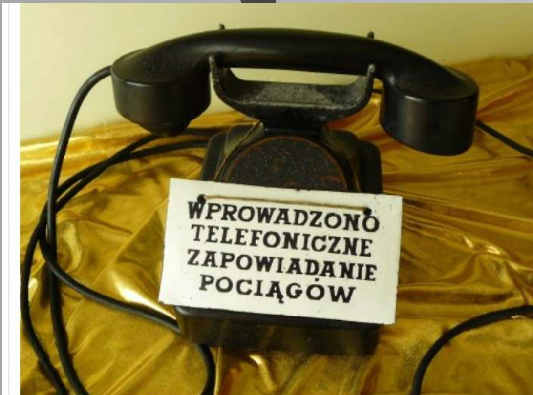
Kolejowy aparat telefoniczny dyżurnego ruchu

Wszystko trzeba było ręcznie lub dźwigami przeładować z szerokich wagonów do tych węższych . Powstały gigantyczny magazyny i rampy przeładunkowe . Kalisz stał się wielkim centrum logistycznym co dawało pracę setką ludzi z miasta i okolic . Przerwa w podróży wynikająca z różnicy torów była idealnym momentem dla celników i straży granicznej . W Kaliszu działała jedna z najważniejszych komór celnych Imperium Rosyjskiego , czyniąc celników jedną z najbogatszych grup w mieście .