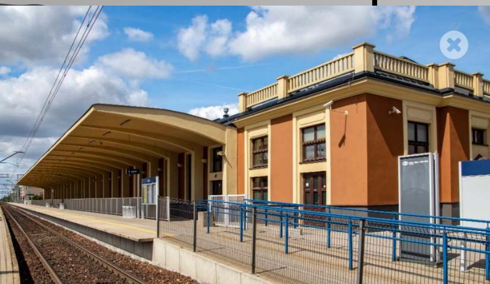
Dworzec kolejowy w Kaliszu