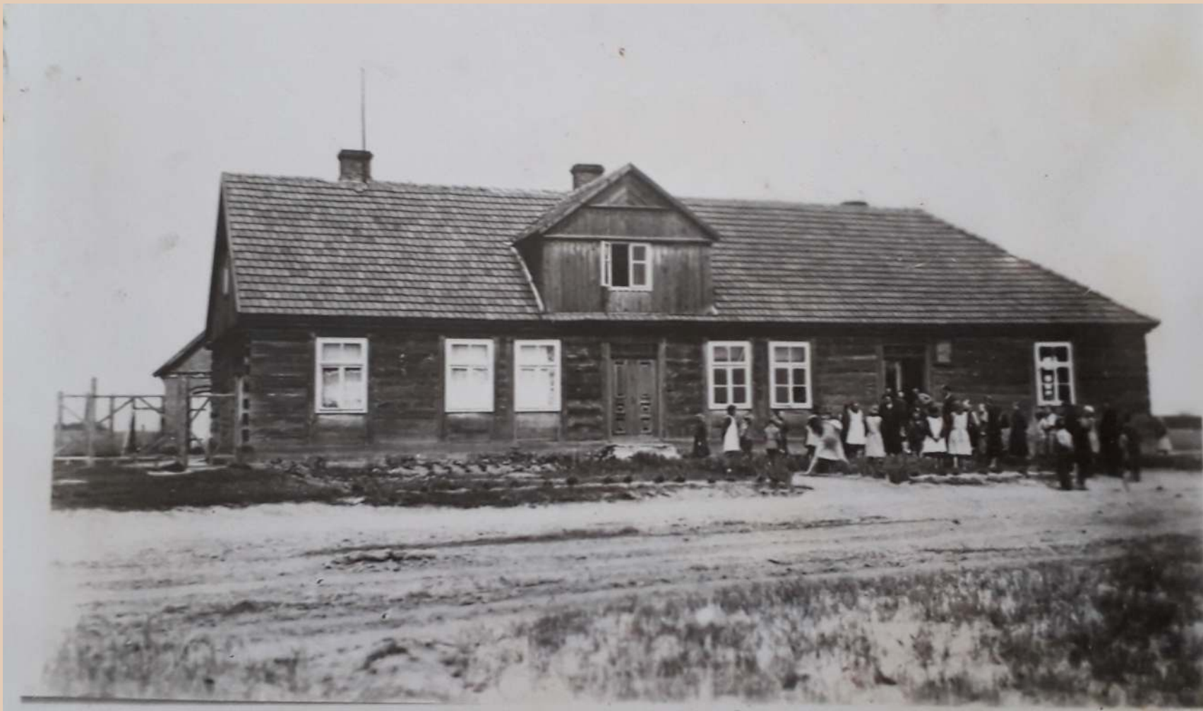
Budynek Szkoły Podstawowej w Przystajni w 1938 r.

W latach 1926-1927 wzniesiono duży, drewniany budynek szkoły podstawowej. Zbudowany został na planie litery L. W części mieszkalnej dla nauczycieli częściowo zagospodarowano strych. Szkoła prowadziła działalność do 1999 r.